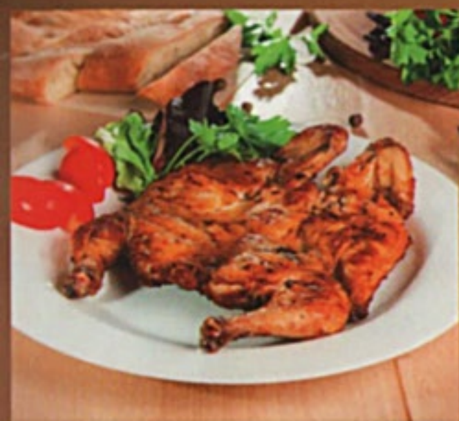
Цыпленок на мангале