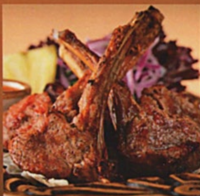
Шашлык из баранины (корейка)