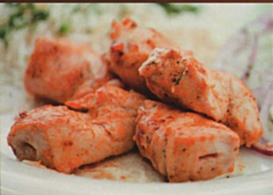
Шашлык из индейки