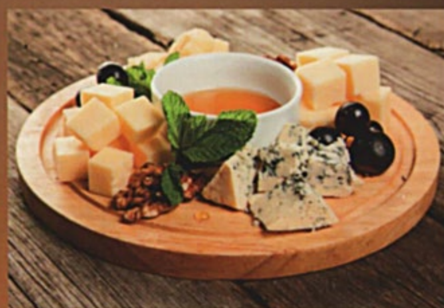
Сырная тарелка винная рос. сыр, чанах, сулгуни, чечил, Дор Блю, мед