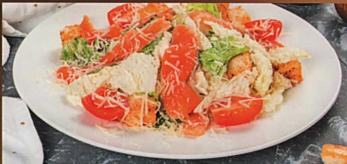
Цезарь с семгой классический