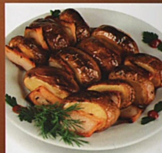
Картофель плеч с курдюком