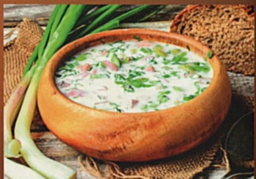
Окрошка на мацуне / на квасе летнее предложение