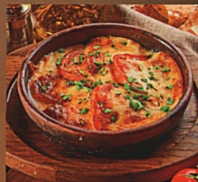
Жареные сулгуни с помидорами на кеце