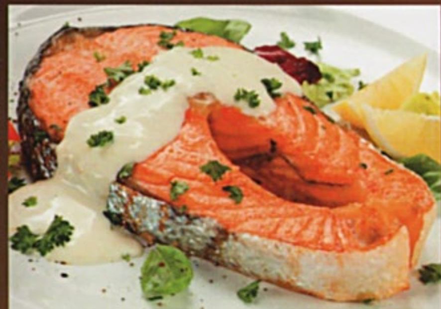
Шашлык из армянской форели