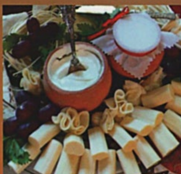
Сырная тарелка Ной