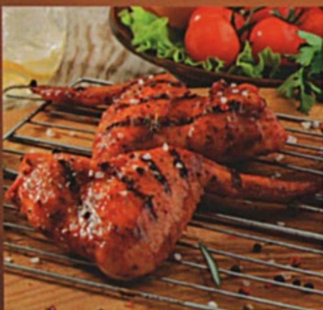
Шашлык куриный (крылышки)