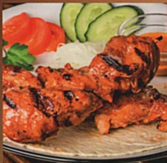
Шашлык из свинины (мякоть)