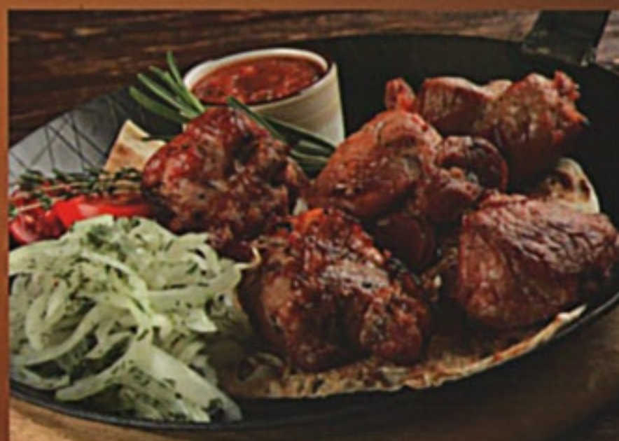
Шашлык из баранины (мякоть)