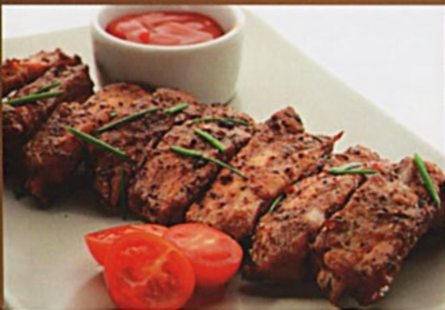
Шашлык из свиных ребрышек