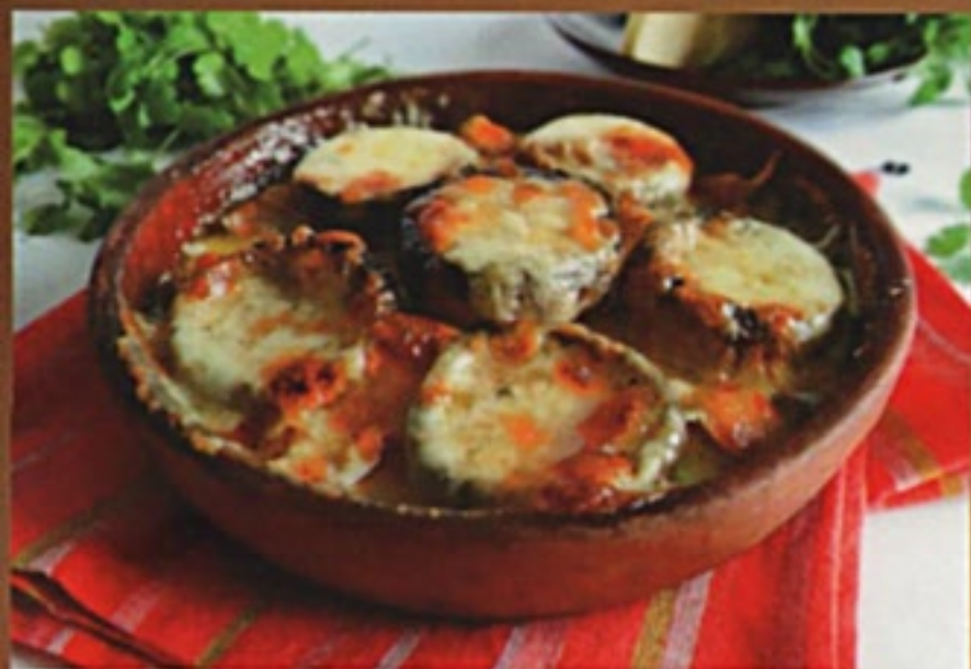
Шляпки грибов на кеце запеченные грибы с маслом и сыром, специи