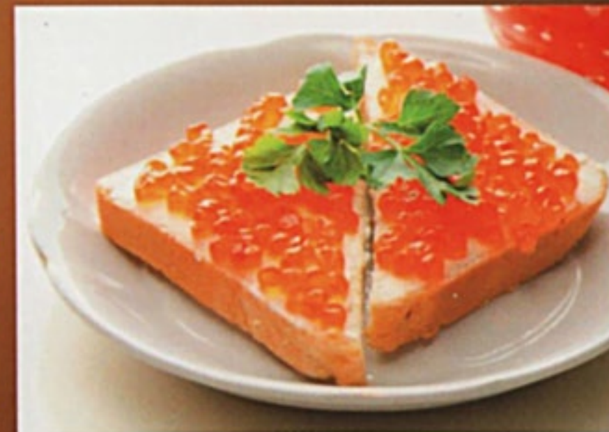
Бутерброд с красной икрой