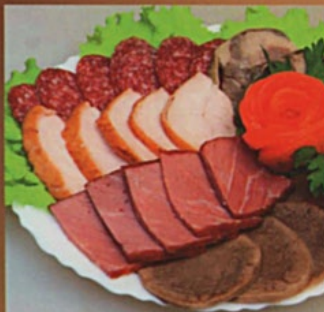
Мясное ассорти Буженина, сервелат т/к, куриный рулет, язык