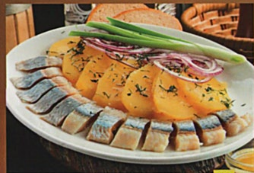
Селедка с картофелем