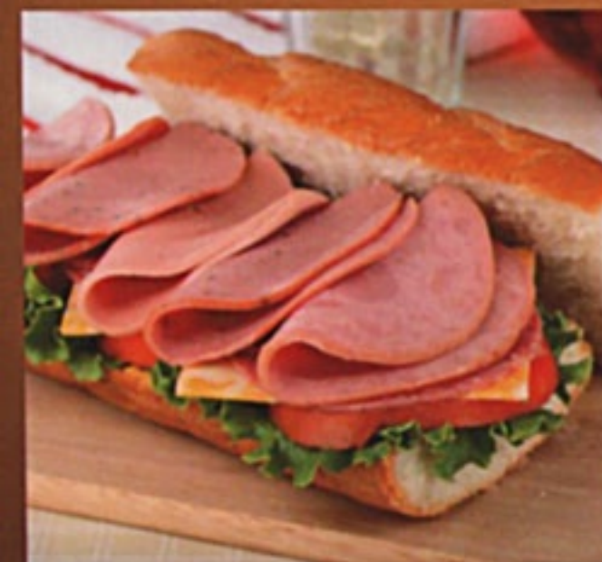
Бутерброд с бужениной