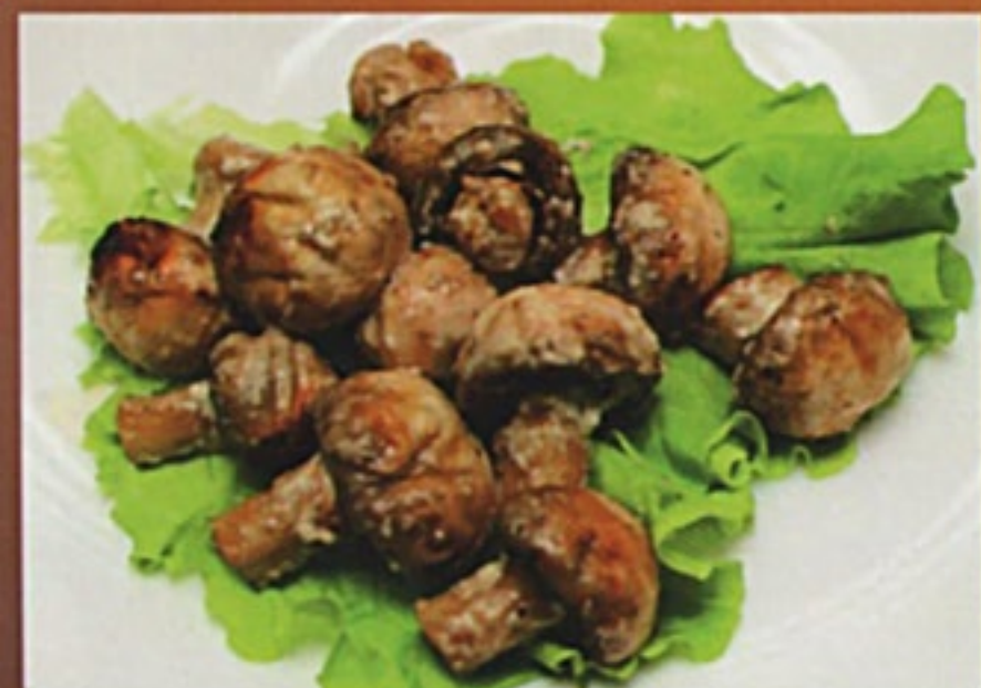
Шашпиньоны на углях