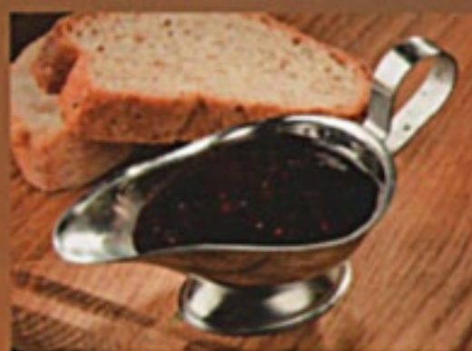
Наршараб 1/50гр 120Р