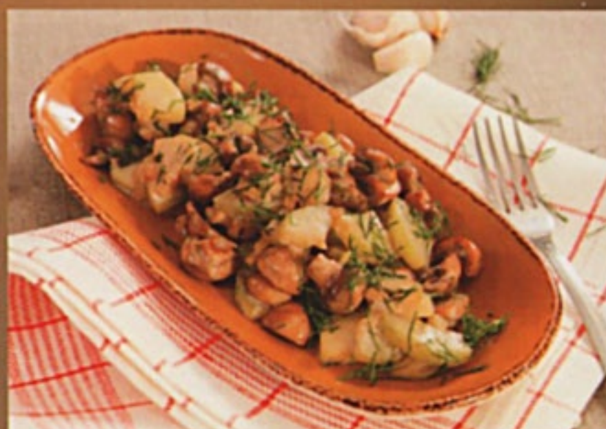
Картофель жареный с грибами и луком