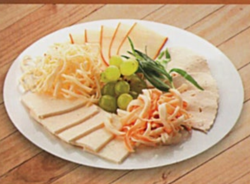
Сырное ассорти рос. сыр, чечил, чанах, сулгуни