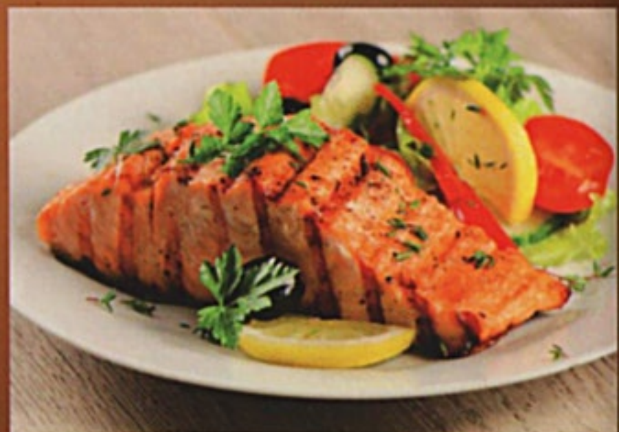
Шашлык из семги