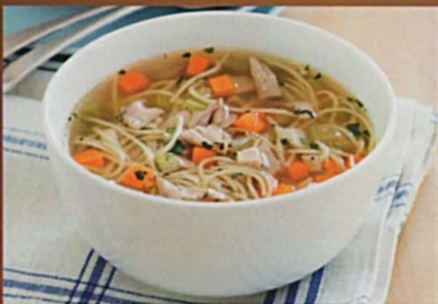
Куриный суп с лапшой