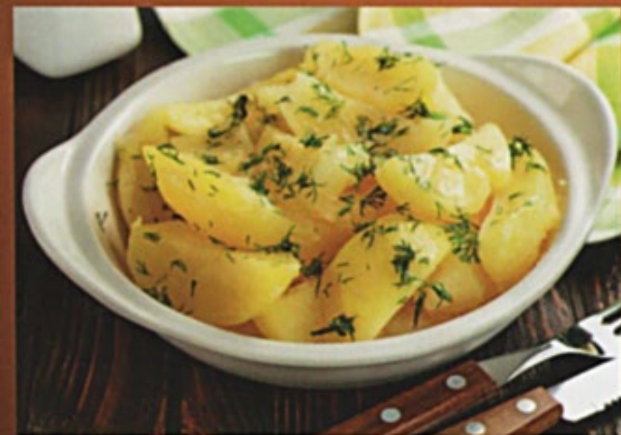
Картофель отварной с зеленью 150Р 150гр