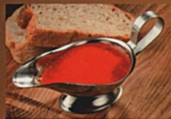
Аджика острая 1/50гр 60Р