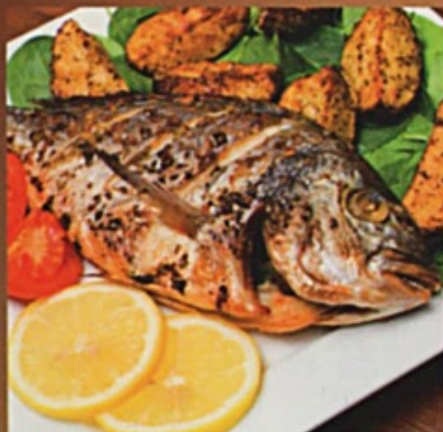
Шашлык из дорадо