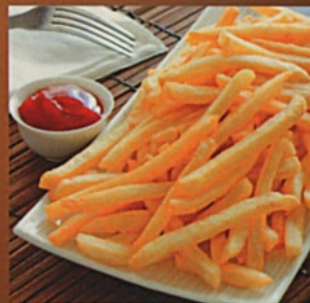
Картофель фри 150Р 150гр