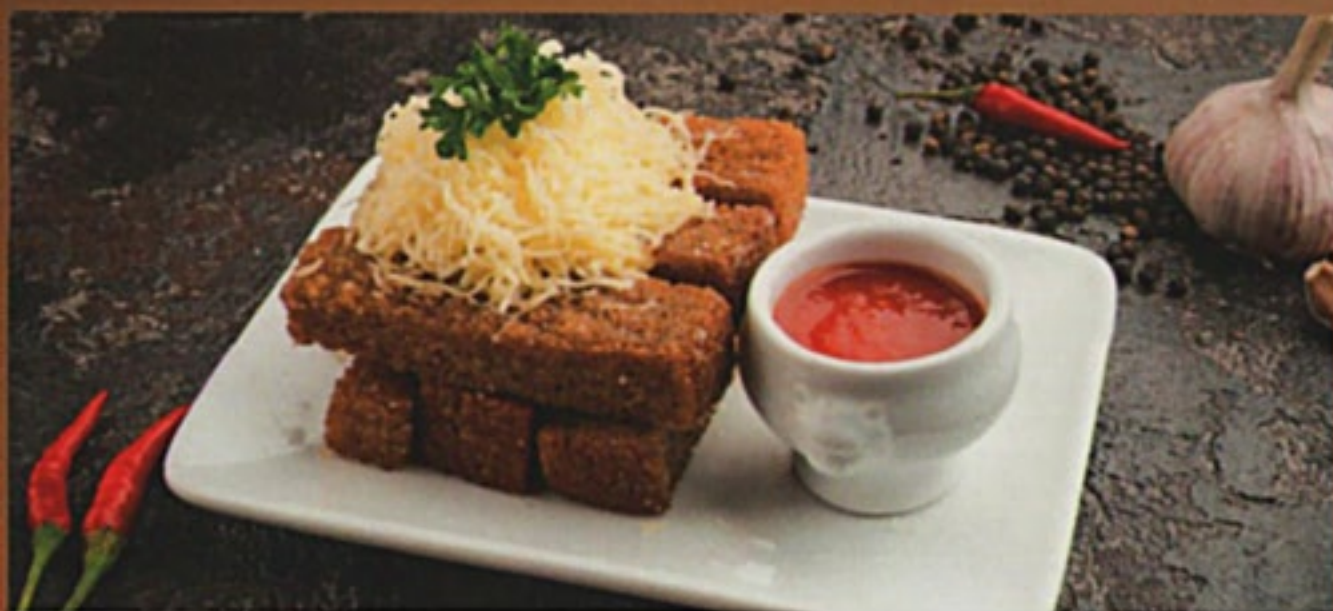
Гренки чесночные с сыром