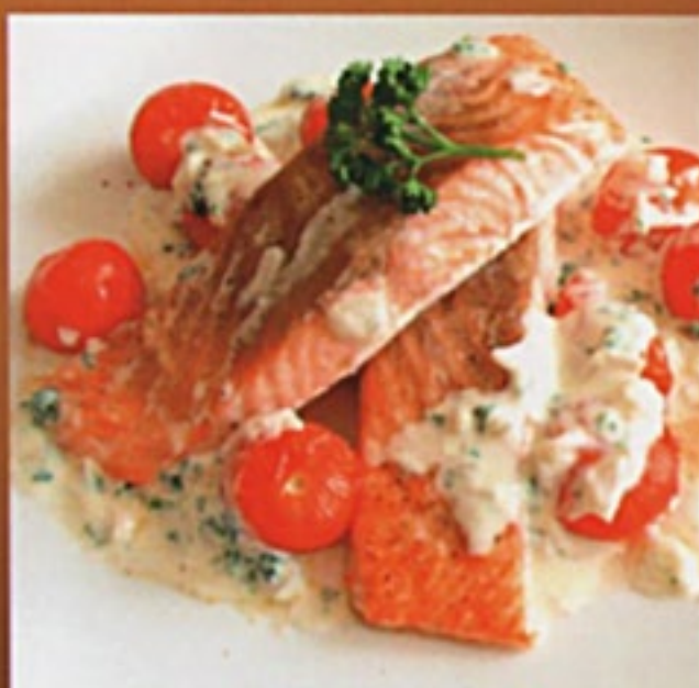
Рыба по-королевски семга, соус жульен, сыр, персик консервированный