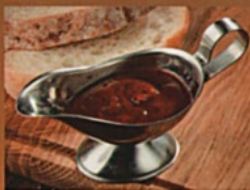
Ткемали 1/50гр 60Р