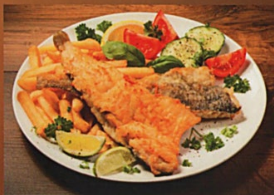
Судак Боярский судак филе, лук репчатый, картофель фри, майонез, сыр