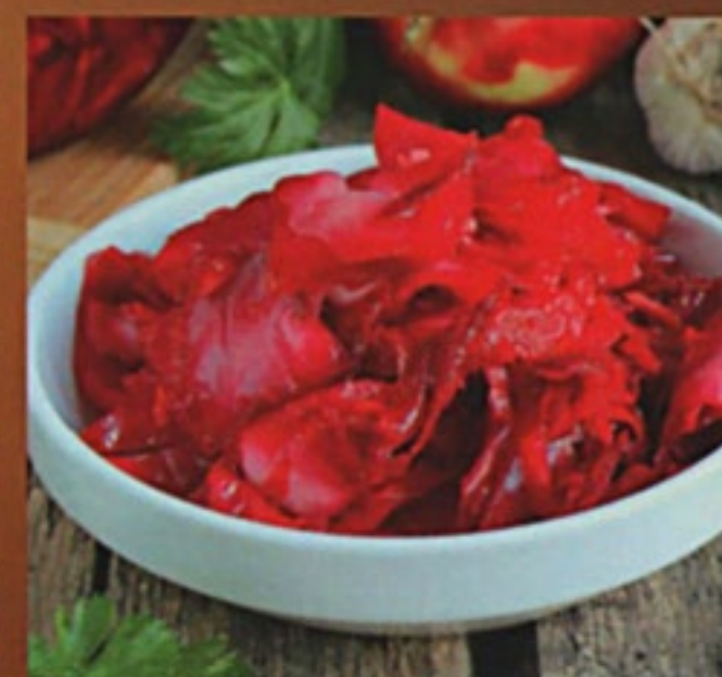
Красная капуста по-грузински