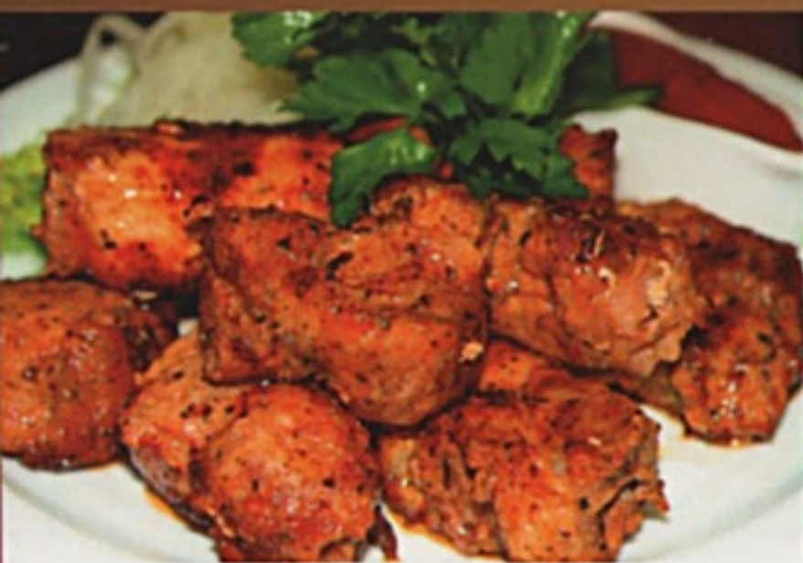
Шашлык из внутренностей баранины (парда)