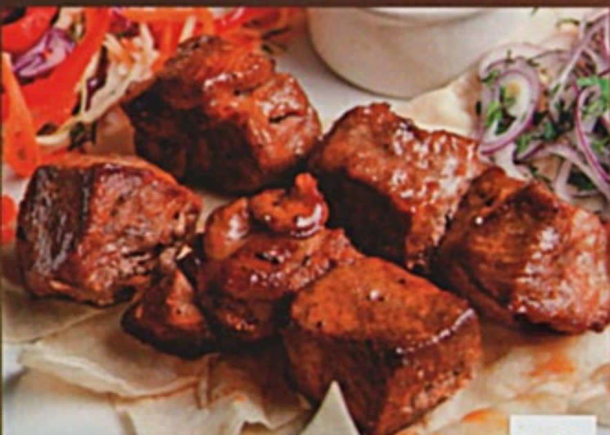
Шашлык из свинины (шея)