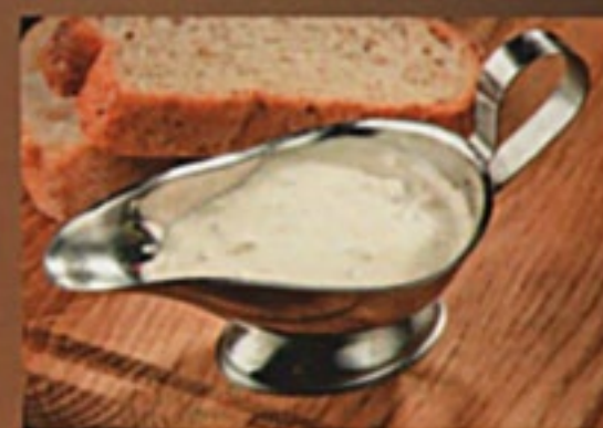
Тар-тар 1/50гр 60Р