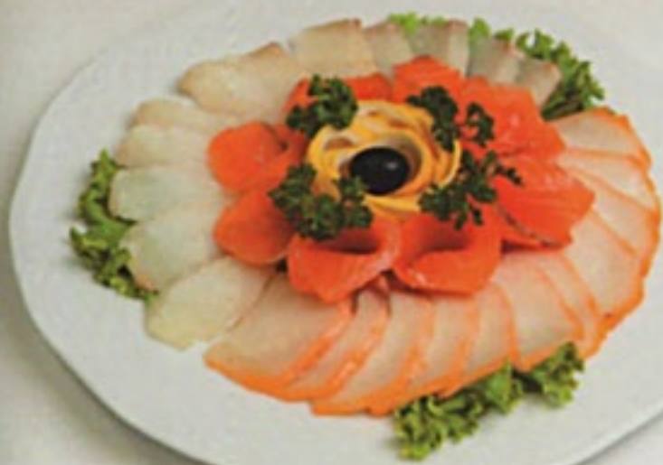
Рыбное ассорти семга, кета, палтус, горбуша