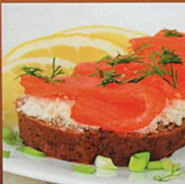
Бутерброд с лососем