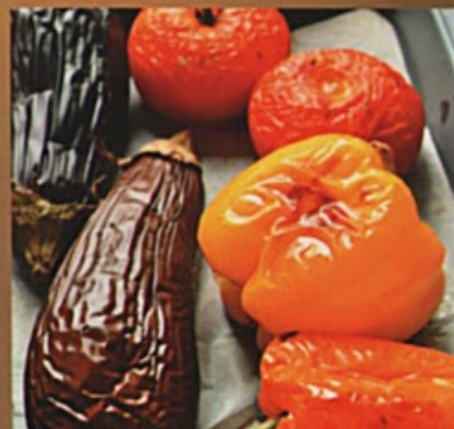
Баклажан/ Помидор/ Перец