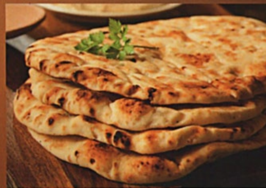
Лаваш из тандыра