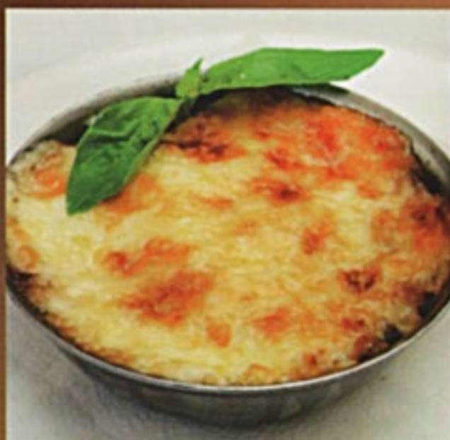
Жульен грибной / Жульен с курицей