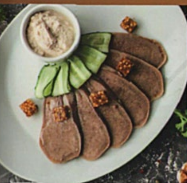
Язык говяжий с хреном