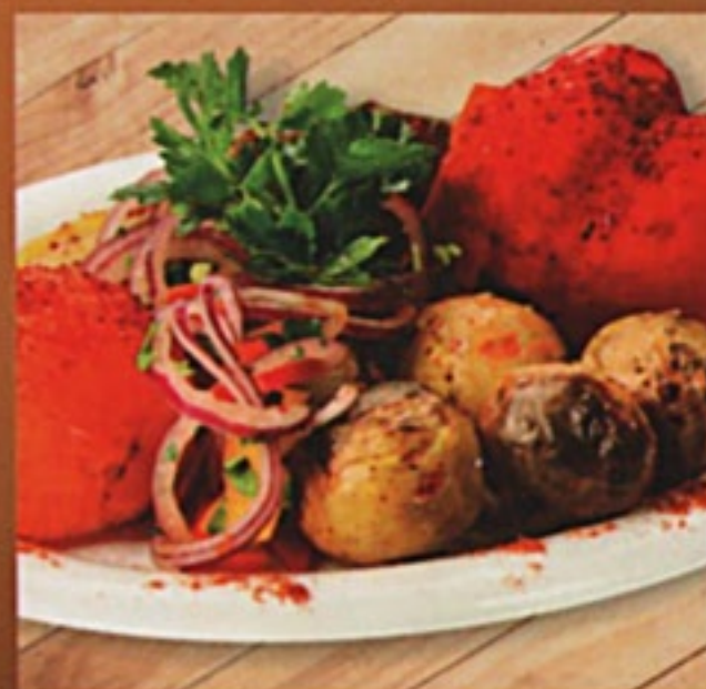
Овощи на углях