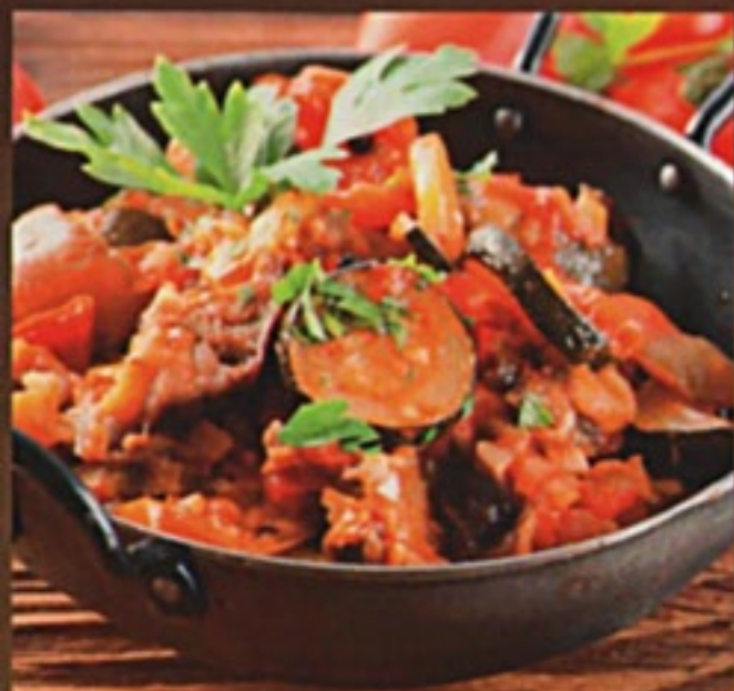
Аджапсандали тушеные овощи