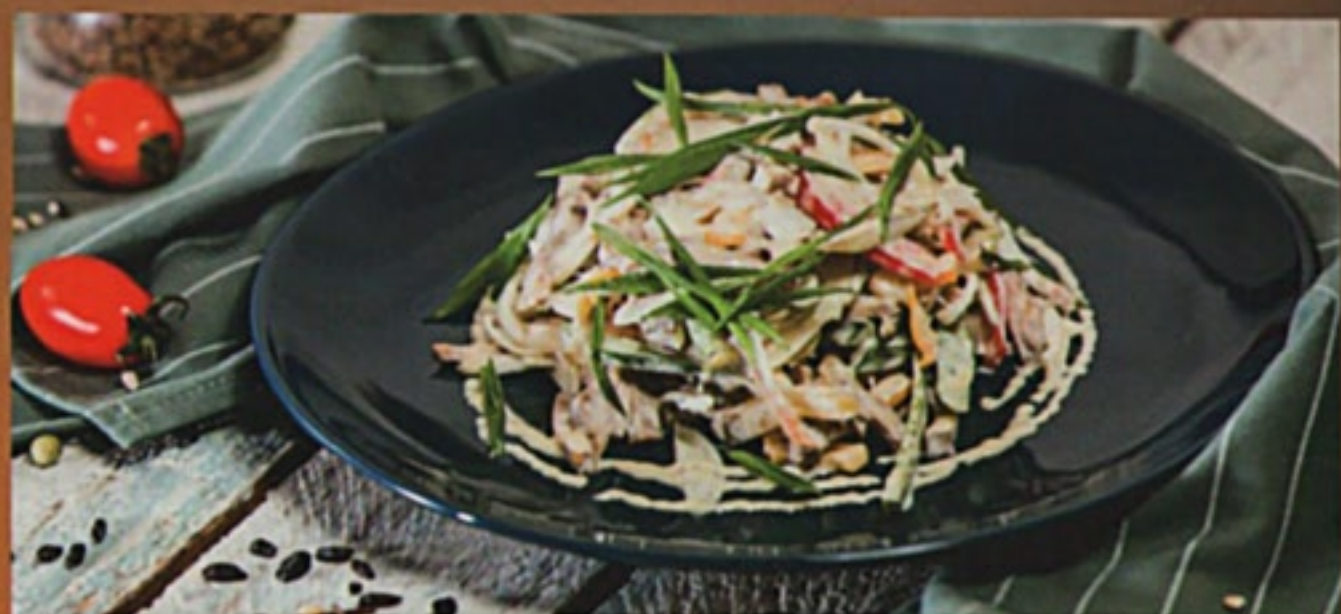
Салат с языком

редиска, свежие огурцы, помидоры, перец болгарский, сыр