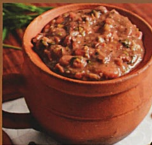
Лоблио красное тушеная фасоль, зелень со специями