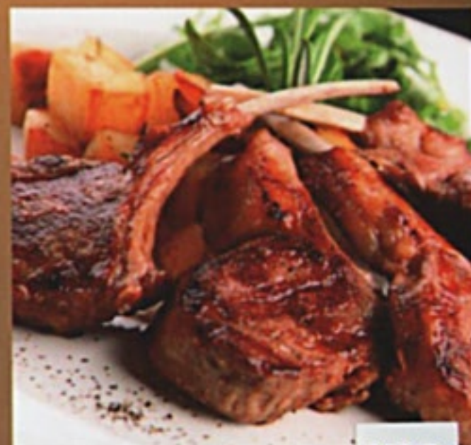
Шашлык свиной на кости (корейка)