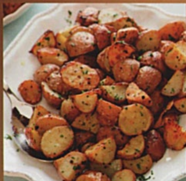
Картофель с салом