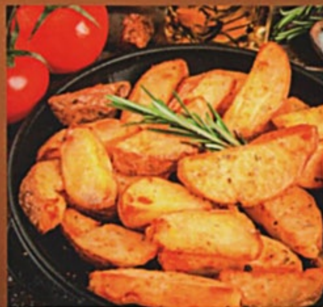
Айдахо 150Р 150гр