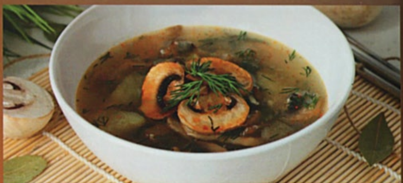
Суп грибной по-деревенски